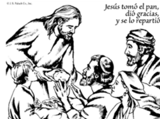
Jesús tomó el pan, dió gracias, y se lo repartió

Lunes: Ex 32:15-24, 30-34; Sal 106 (105):19-23; Mt 13:31-35 Martes: Ex 33:7-11; 34:5b-9, 28; Sal 103 (102):6-13; Mt 13:36-43 Miércoles: Ex 34:29-35; Sal 99 (98):5-7, 9; Jn 11:19-27 o Lc 10:38-42 Jueves: Ex 40:16-21, 34-38; Sal 84 (83):3-6a, 8a, 11; Mt 13:47-53 Viernes: Lv 23:1, 4-11, 15-16, 27, 34b-37; Sal 81 (80):3-6, 10-11ab; Mt 13:54-58 Sábado: Lv 25:1, 8-17; Sal 67 (66):2-3, 5, 7-8; Mt 14:1-12