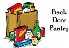
Back Door Pantry

The Backdoor Pantry offers free food for those in need. It is located on the southside of Grace Hall the first window. The Back Door Pantry is open every Friday from 3-4:30pm. If you would like to donate to the Back Door Pantry, there is a drop-off pantry box located at the back of the Church. Please, only non-perishable foods (no fresh or frozen items). Thank you.