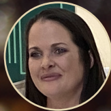
CAITLIN FLOCK BISHOP GALLEGOS MATERNITY HOME