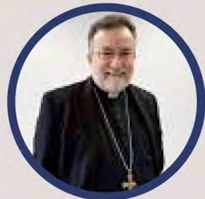
Reverendo Opispo Jaime Soto