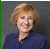
Parish Council Secretary

Estate Planning and Real Property attorney serving Lake Tahoe. Call for a free consultation.