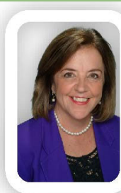
Your Church Music Director

Each Office is Independently Owned and Operated.