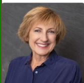
Parish Council Secretary

Estate Planning and Real Property attorney serving Lake Tahoe. Call for a free consultation.