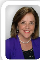
Your Church Music Director