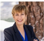
Parish Council Secretary

Estate Planning and Real Property attorney serving Lake Tahoe. Call for a free consultation.