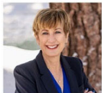
Parish Council Secretary

Estate Planning and Real Property attorney serving Lake Tahoe. Call for a free consultation.