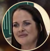
CAITLIN FLOCK BISHOP GALLEGOS MATERNITY HOME