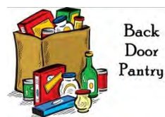
Back Door Pantry

The Backdoor Pantry offers free food for those in need. It is located on the southside of Grace Hall the first window. The Back Door Pantry is open every Friday from 3-4:30pm. If you would like to donate to the Back Door Pantry, there is a drop-off pantry box located at the back of the Church. Please, only non-perishable foods (no fresh or frozen items). Thank you.