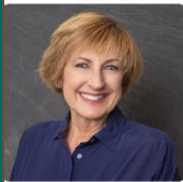
Parish Council Secretary