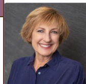
Parish Council Secretary

Monday: 2 Kgs 5:1-15ab; Ps 42:2, 3; 43:3, 4; Lk 4:24-30 Tuesday: Dn 3:25, 34-43; Ps 25:4-5ab, 6 & 7bc, 8-9; Mt 18:21-35 Wednesday: Dt 4:1, 5-9; Ps 147:12-13, 15-16, 19-20; Mt 5:17-19 Thursday: Jer 7:23-28; Ps 95:1-2, 6-7, 8-9; Lk 11:14-23 Friday: Is 7:10-14; 8:10; Ps 40:7-8a, 8b-9, 10, 11; Heb 10:4-10; Lk 1:26-38 Saturday: Hos 6:1-6; Ps 51:3-4, 18-19, 20-21ab; Lk 18:9-14 Sunday: Jos 5:9a, 10-12; Ps 34:2-3, 4-5,6-7; 2 Cor 5:17-21; Lk 15:1-3,11-32