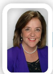
Your Church Music Director

900 Emerald Bay Road • South Lake Tahoe, CA 96150